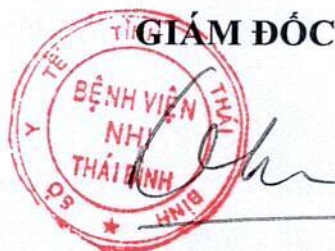
Lương Đức Sơn